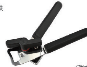
CRTH0003 手持式开罐器 (瑞士) 185x50x50mm