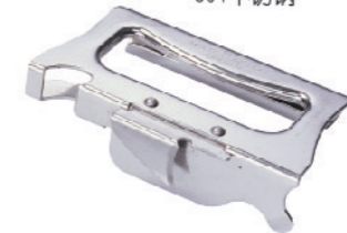
SN4776 开罐器 110x65x29mm