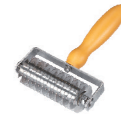
SN4217 不锈钢拉网刀(电解) 193x138x44mm