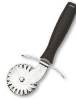
SN4243 波浪轮刀 圆径52x175mm 420不锈钢