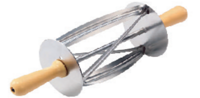
SN4240 三角型面团轮刀 总长413 刃长200 圆径120mm 304不锈钢