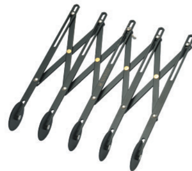
SN4225 5轮单用轮刀(1000系列不沾) 长度235mm