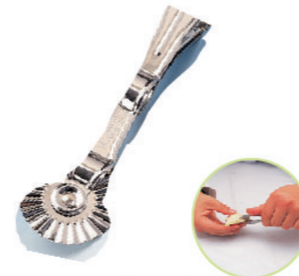
SN4230 两用夹轮刀(电解) 长度203mm 304不锈钢