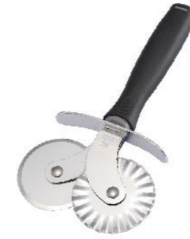
SN4244 两用起酥轮刀 圆径52x175mm 420不锈钢