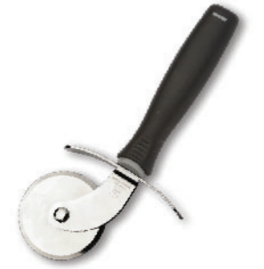
SN4245 起酥轮刀 圆径52x175mm 420不锈钢