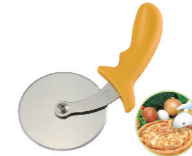
SN4233 披萨轮刀 圆径100x232mm 430不锈钢