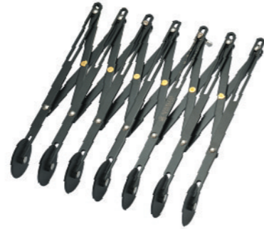
SN4226 7轮单用轮刀(1000系列不沾) 长度235mm