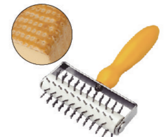
SN4218 不锈钢针车轮 198x130x50mm