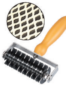
SN4216 不锈钢拉网刀(1000系列不沾) 193x138x44mm