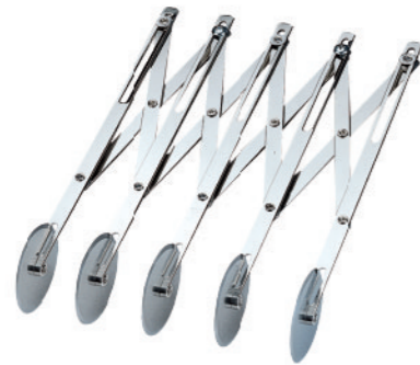
SN4223 5轮单用轮刀(电解) 长度235mm

有刻度轮刀专利号码: 201020580613.4 高贵不贵! 仪器的品质, 工具的价格。