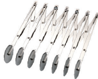
SN4224 7轮单用轮刀 长度235mm