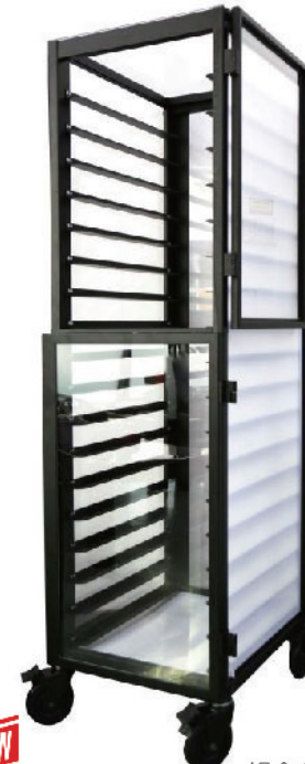
SN1978 18层固定密封式铝合金台车(阳极) 628x486x1700mm