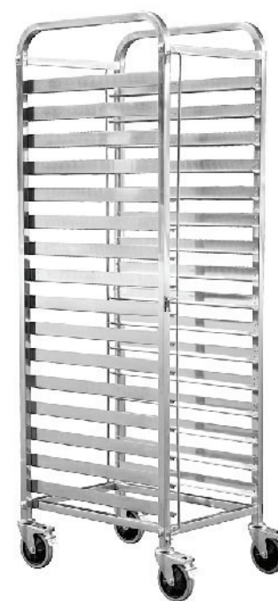
SN1971 16层固定式不锈钢台车 620x470x1730mm 层高85mm 配套600x400烤盘