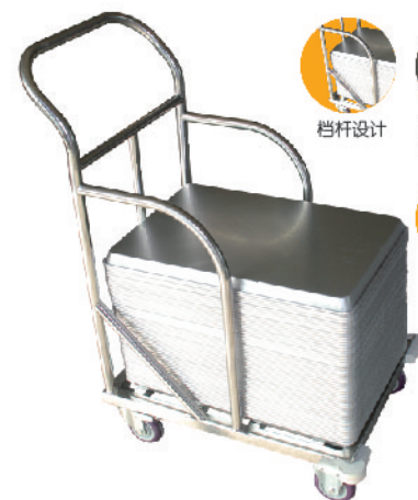
SN1980 不锈钢手推车 201不锈钢 645x475x980mm(耐重200kg) 专利号码：201120290936.4