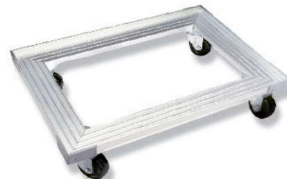
SN1987 铝合金平台车(阳极) 620x420x135mm(耐重250kg)