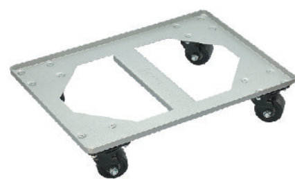
SN1982 平台车(烤漆) 2.5mm碳钢 610x410x125mm(耐重800kg)