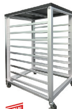
SN1969 8层固定式铝合金台车(阳极) 603x471x900mm