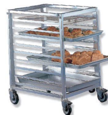
SN1997 9层固定式铝合金台车(阳极) 603x471x1003mm 层高80mm 配套600x400烤盘