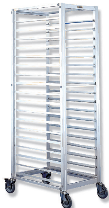
SN1990 配套718x460、660x460烤盘 SN1995 配套600x400烤盘