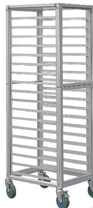
SN1961 18层固定密封式铝合金台车(阳极) 628x486x1700mm 层高80mm 配套600x400烤盘