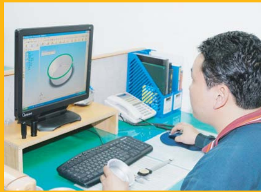
高素質的研發團隊