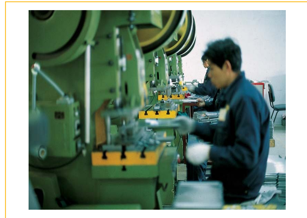
順暢的生產流水線