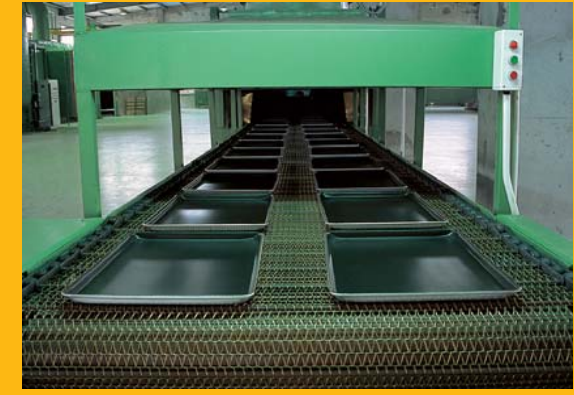
先進的不沾處理流水線