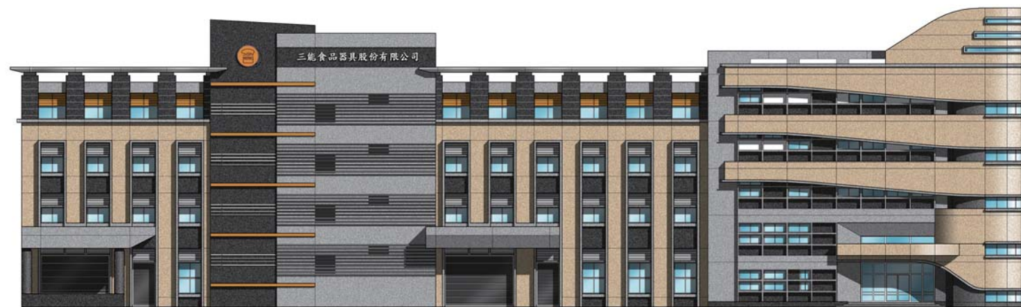
台灣三能大里工廠立體圖